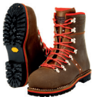
Tirol Juchten Forstschuh Art. 103177