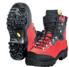
Zermatt GTX Forstschuh Art. 100234