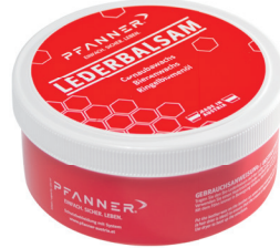
Art. 100025 Lederbalsam