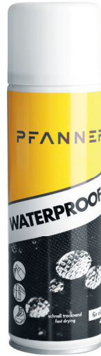
Art. 101911 Waterprooffer