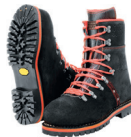
Tirol Fighter Forstschuh Art. 103185